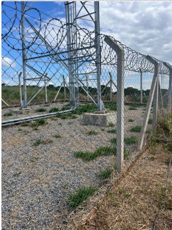
Registro 01: Lote onde está instalado a Torre.